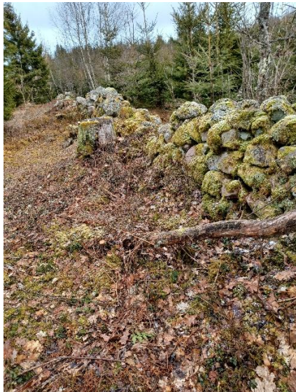
... gammal kulturbygd ...